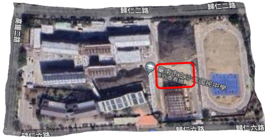
說明：紅框處為風雨球場預定位置